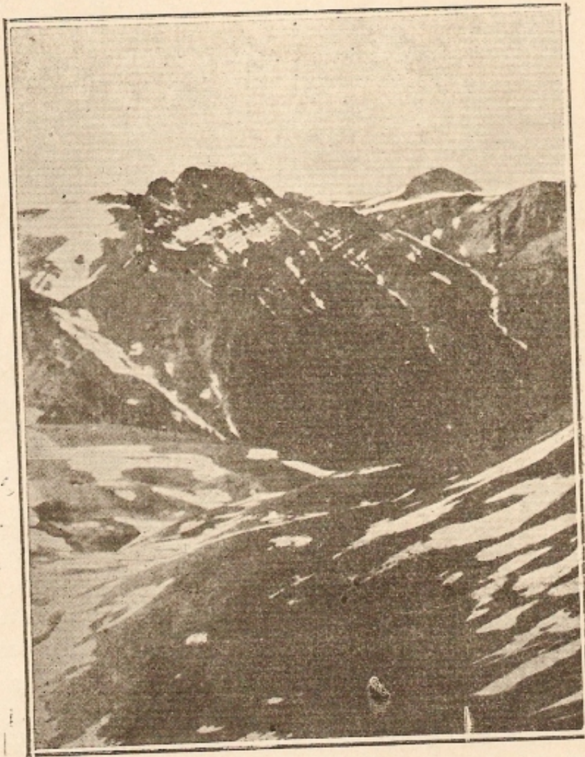
Λι ψηλότερες κορυφές τοῦ Ὀλύμπου (Διός, Δόξης καὶ Βενιζέλου)